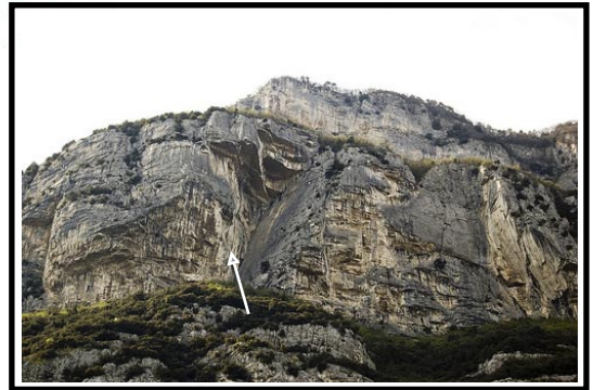
→ soste con catene

Richiodata nel 1997 mantenendo egual numero e distanza delle protezioni.